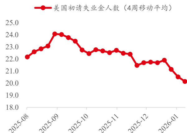
图表1：美国初请失业金人数（万人）

经济数据方面，美国申领失业金人数小幅下降，核心PCE环比增速放缓，美国经济延续软着陆，国债利率期货市场显示，市场预期美联储下一次降息的时间点进一步推迟至7月。